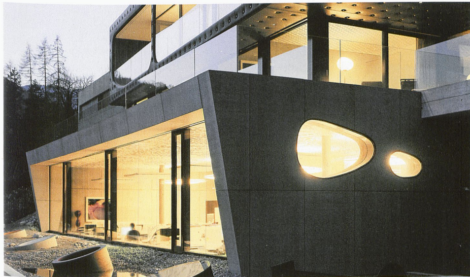
«Casa Martinez», villa neuve avec bureaux, Berneck | Fenêtres EgoKiefer XL®2020 en bois/alu.

Les fenêtres et portes coulissantes à levage EgoKiefer XL®2020 offrent davantage de lumière et de design. Leur esthétique, maintes fois primée, ne laisse pas de séduire. Avec leurs profilés minces, les gains d'énergie et les indices d'isolation thermique se traduisent par des frais de chauffage réduits au minimum.