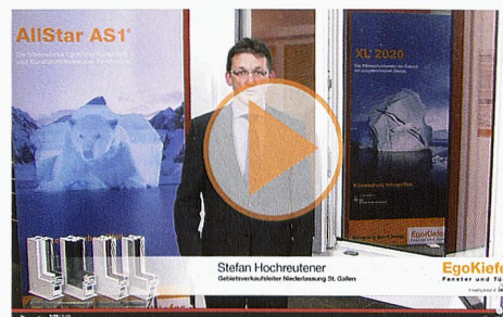
Porte coulissante à levage EgoKiefer XL®2020 en bois/alu et porte coulissante à levage EgoKiefer XL®2020 en PVC/alu.

MINERGIE® EgoKiefer est partenaire principal de MINERGIE®