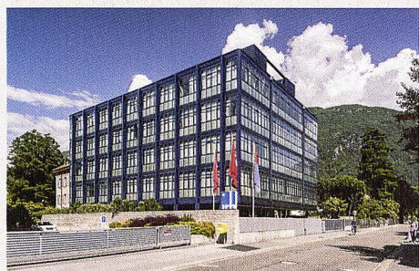
Institut de Recherche Biomédicale

Suite à l'intervention réussie des associations professionnelles tessinoises contre le concours pour le nouvel Institut de Recherche Biomédicale (IRB) de Bellinzzone, le marché a été remis au concours. Que critiquaient les opposants au programme du concours d'origine ?