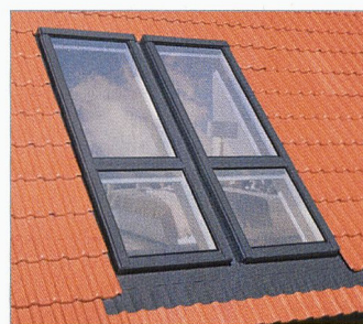
Fenêtre fermée avec balustrade de protection installée de manière invisible

La fenêtre-balcon Galeria FAKRO est un nouveau type de fenêtre de toit avec une énorme surface translucide qui s'intègre parfaitement à la toiture. Le grand angle d'ouverture du vantail supérieur ainsi que le vantail inférieur rabattable vers l'extérieur permettent un accès confortable jusqu'à la balustrade du balcon. Votre bien immobilier gagnera en valeur grâce à cette fenêtre de toit esthétique, avec fonction intégrée de balcon.