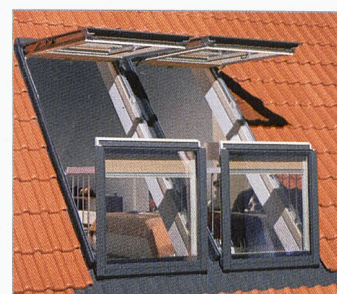
Sortez à l'air frais et profitez de la vue