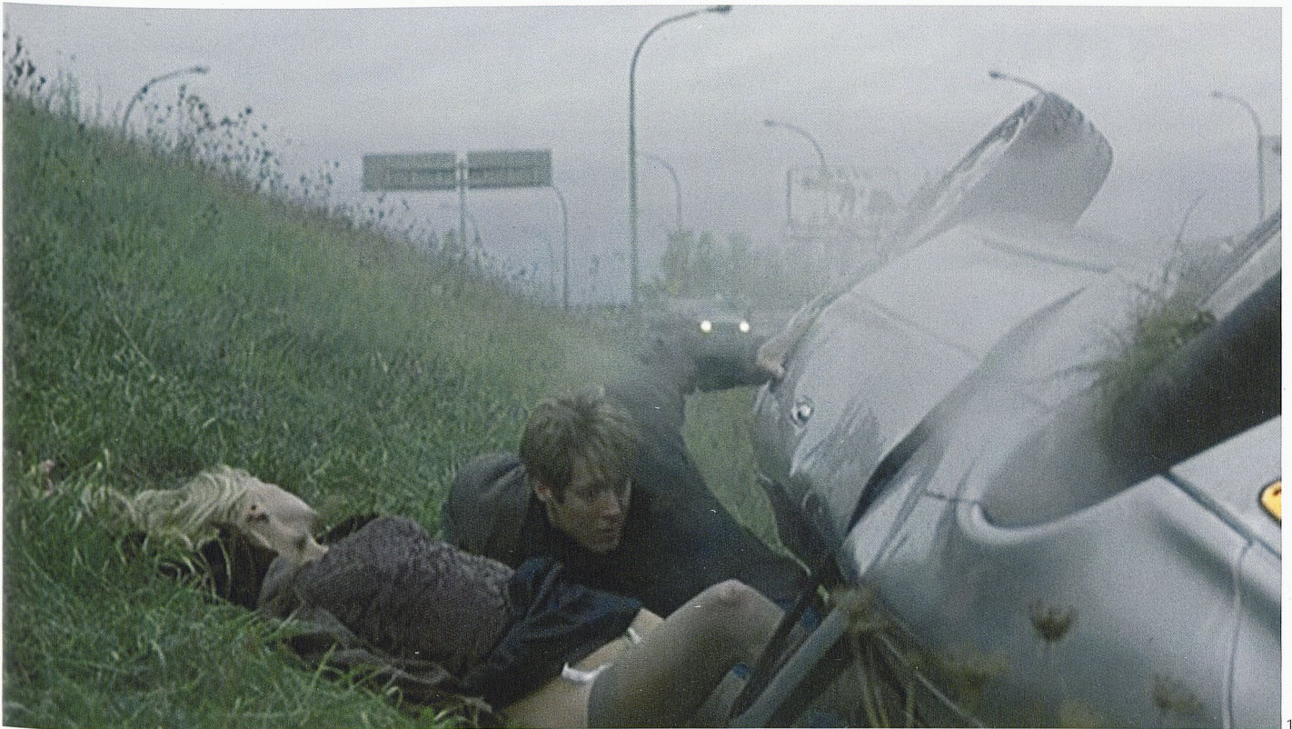
1 Photogramme de l'adaptation de Crash au cinéma par David Cronenberg (1996).

Les paysages ballardiens ont les mêmes couleurs que celles du Désert rouge (1964) de Michelangelo Antonioni : le gris y règne au sein d'une atmosphère qui semble être l'objet de production de ces usines et automobiles qui peuplent ces paysages. Seules les couleurs télévisuelles restent vives lorsqu'elles nous montrent les visages de Ronald Reagan et Margaret Thatcher. Ballard prend un soin particulier à désacraliser ces idoles, à les souiller de leur propre matière corporelle.