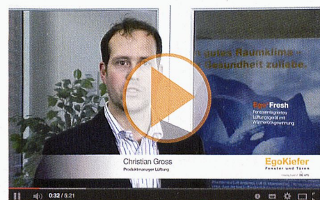
Ego®Fresh, le système d'aération multilocal compatible avec MINERGIE®

MINERGIE® EgoKiefer est partenaire principal de MINERGIE®