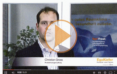
Ego®Fresh, le système d'aération multiloaux compatible avec MINERGIE®

MINERGIE® EgoKiefer est partenaire LEADING PARTNER principal de MINERGIE®