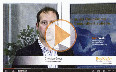
Ego®Fresh, le système d'aération multiloaux compatible avec MINERGIE®

MINERGIE® EgoKiefer est partenaire LEADING PARTNER principal de MINERGIE®