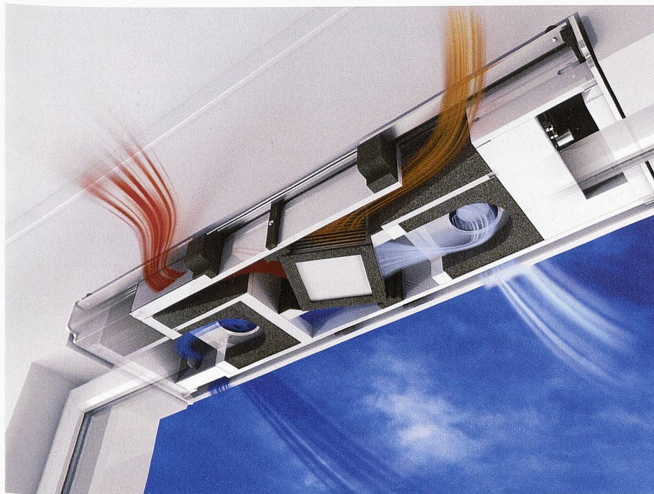
Ego®Fresh, le système d'aération parfait avec récupération de chaleur. Pour un air sain dans les pièces.

Avec son système d'aération multilocal, EgoKiefer offre une alternative intéressante à l'aération centralisée car Ego®Fresh possède une récupération de chaleur intégrée et est compatible avec MINERGIE®. Ce système permet d'avoir un air sain dans les pièces sans recourir à des canaux d'aération.