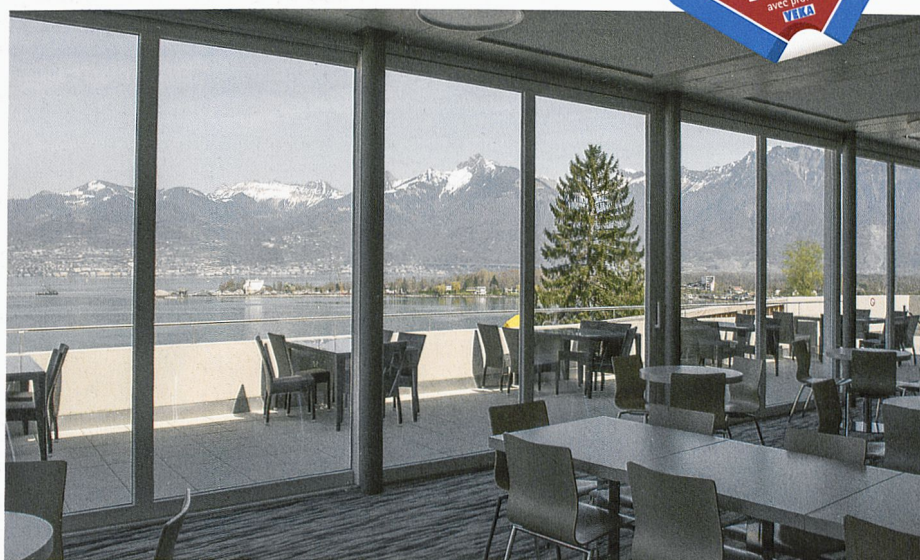
Le nouveau bâtiment de formation et d'habitation de l'école hôtelière César Ritz du Bouveret.

Les César Ritz Colleges Switzerland, dont la renommée repose sur la réussite de l'hôtelier César Ritz, pionnier dans le secteur des hôtels de luxe, forment de futurs chefs cuisiniers et gérants d'hôtels. Convivialité, espaces vastes, fonctionnalité et exigences esthétiques élevées font partie des critères qu'exigeait leur architecture. Les composants systèmes intégraux ont fait pencher la balance en faveur du système de profilés SOFTLINE 70 MD: conformément aux exigences, ils permettent en effet de fabriquer également sur mesure des fenêtres de grandes dimensions. Equipées de vitrages isolants à haute performance thermique, les fenêtres ont été complétées par un système de porte-fenêtre levante coulissante, parfaitement compatible, de la série haut de gamme VEKASLIDE. Ce système conçu spécialement pour les grands formats séduit à la fois par ses remarquables propriétés isolantes et par son design classique. Des châssis aux sur-