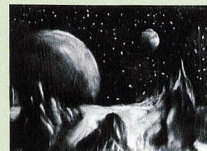
The astronaut (© Marc Bauer)