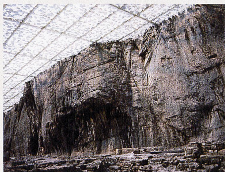
Couverture des ruines archéologiques Saint-Maurice

Du 3 au 26 avril 2014, les ouvrages ayant reçu la distinction SIA UMSICHT - REGARDS - SGUARDI 2013, qui récompense des réalisations durables et porteuses d'avenir, seront exposés à l'Ecole polytechnique fédérale de Lausanne (EPFL). Deux projets romands ont été primés.