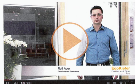
Porte coulissante à levage EgoKiefer XL®2020 en bois/alu et porte coulissante à levage EgoKiefer XL®2020 en PVC/alu.

Vidéos de produits: www.egokiefer.ch/innovations