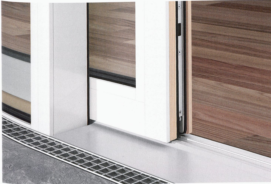
Portes-fenêtres EgoKiefer avec vide lumière maximal et seuils accessibles aux fauteuils roulants.

Les systèmes intelligents améliorent la qualité de vie. L'ouverture et la fermeture automatiques de portes coulissantes à levage ou la construction de seuils accessibles aux fauteuils roulants accroissent le confort et la maniabilité pour tous.