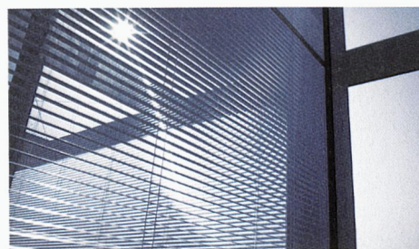
Protection solaire du futur: le store intégré dans le vitrage isolant.