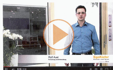
Porte coulissante à levage EgoKiefer XL®2020 en bois/alu et porte coulissante à levage EgoKiefer XL®2020 en PVC/alu.

Vidéos de produits: www.egokiefer.ch/innovations