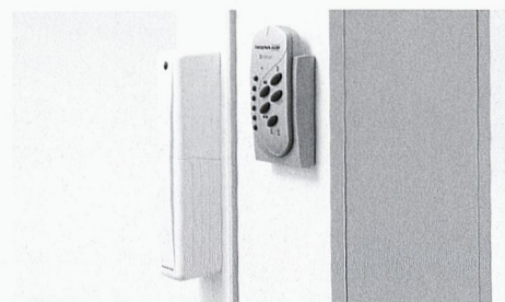
Portes coulissantes à levage avec entraînement motorisé.

Les grandes fenêtres qui descendent jusqu'au plancher sont caractéristiques de l'architecture contemporaine et témoignent des tendances actuelles en matière d'habitat. En outre, la construction d'immeubles et de pièces sans entraves architecturales est depuis longtemps la règle pour toute nouvelle construction. Dans les rénovations, elle est appliquée chaque fois que c'est possible. Les portes-fenêtres coulissantes à levage EgoKiefer créent une nouvelle sensation d'espace et offrent aussi d'intéressantes possibilités pour les architectes. Ces nouveaux produits se distinguent enfin par leur utilisation confortable et leurs seuils bas.