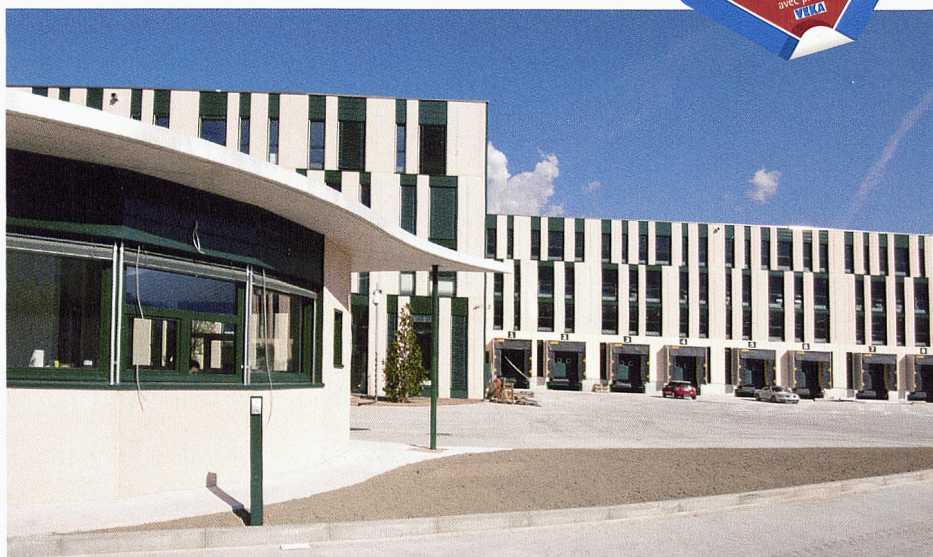
Le nouveau centre logistique Gucci mise sur SOFTLINE 82

D'un point de vue architectural, il était important que le système de fenêtres choisi permette de réaliser des vitres très élancées assurant une luminosité maximale à l'intérieur du bâtiment. D'une part, cette option a pour avantage d'agir positivement sur la sensation générale d'espace. D'autre part, la lumière du jour augmente le bien-être au travail et, par là même, la productivité des collaborateurs. Les fenêtres étroites à battants et feuillure, sélectionnées et fabriquées sur mesure, permettent de disposer dorénavant d'une part de vitrage pouvant atteindre 77% et fournissent ainsi une lumière naturelle agréable dans les différentes halles. La version choisie est baptisée «swisswindows classico alu» et se caractérise