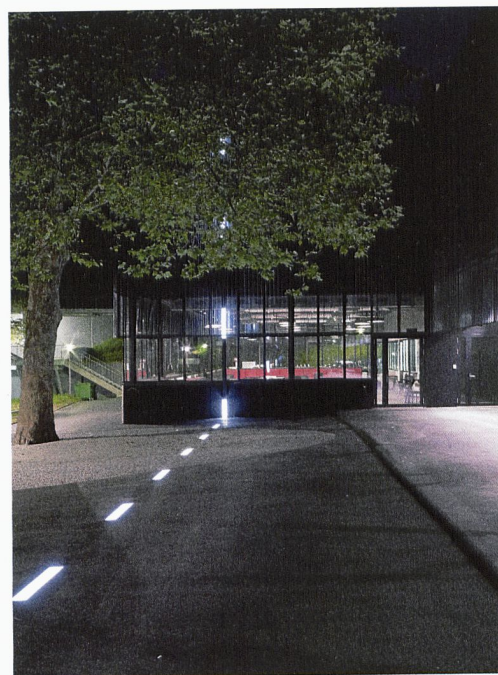
L'installation lumineuse dans la cour du théâtre Arseneo