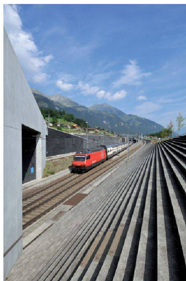
Portail nord avec escalier d'évacuation