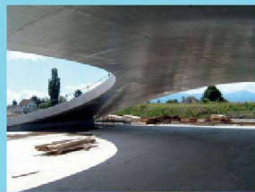
SANAA Kazuyo Sejima & Ryue Nishizawa, Rolex Learning Center, EPFL Lausanne, 2005-2010

Deutsches Architekturmuseum Frankfurt am Main www.dam-online.de