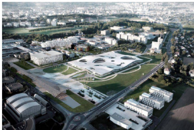
Représentation du campus de l'EPFL (Image de synthèse DPA/Adagp)