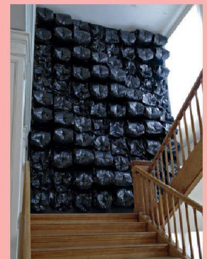
Nils Volker, Eighty-eight #2, 2013, installation

EXPOSITION COUP DE SAC Mudac, Lausanne www.mudac.ch