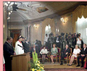
De la série Protokoll, 2007

EXPOSITION CHRISTIAN LUTZ, TRILOGIE Musée de l'Élysée, Lausanne www.elysee.ch