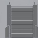
Wey pour gestion des eaux et protection contre les hautes eaux.