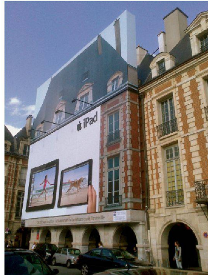
Bâche publicitaire, place des Vosges, Paris (Norma Senejic)