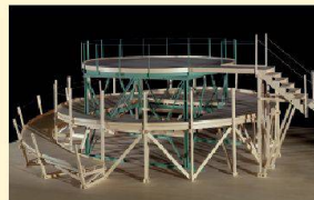
Maquette de la scène, 1924/1987

Museum Villa Stuck, Prinzregentenstraße 60, Munich www.villastuck.de