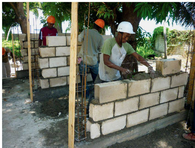
Atelier de formation de maçons