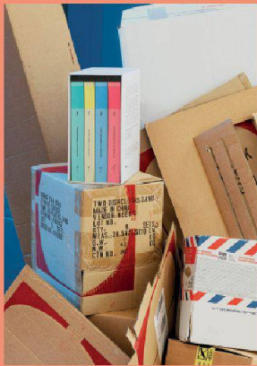
Linogravure sur carton: ECAL/Nicolas Degrange

Auditoire IKEA, ECAL + Design Studio Renens ecal.ch/fr/1705/evenements/autres