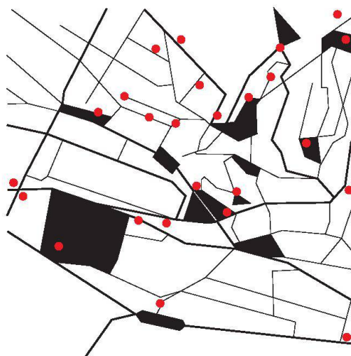
Carte des futurs sites du parcours de Lausanne Jardins 2014 (Association Jardin urbain, réalisation Gavillet & Rust modifiée par TRACÉS)