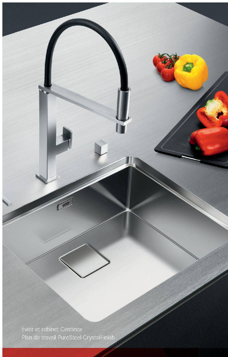
Evier et robinet Centinox Plan de travail PureSteel CrystalFinish