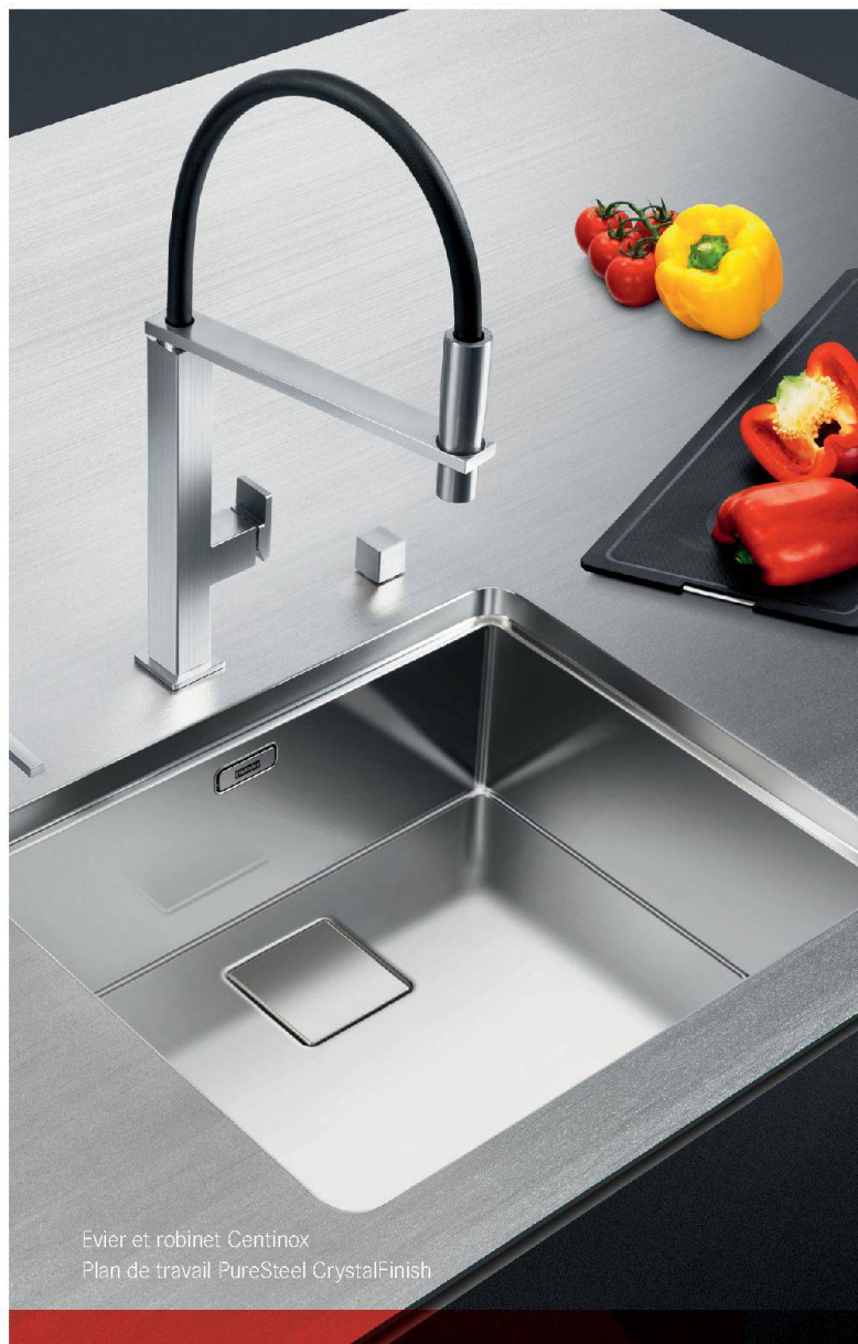
Évier et robinet Centinox Plan de travail PureSteel CrystalFinish

Si l'histoire de la construction du Lignon est passionnant, la description de la méthodologie et des résultats obtenus par l'étude du laboratoire de l'EPFL ne le sont pas moins. Ce livre aborde la question de l'émergence d'un nouveau patrimoine, celui du 20 e siècle, confronté à des exigences inédites de durabilité. Il y donne une réponse précise et fondée : les interventions respectueuses de l'existant peuvent être économiquement avantageuses et offrir de très bons résultats d'un point de vue énergétique. Comme le souhaite Franz Graf en conclusion, nous ne pouvons qu'espérer que cette étude constitue « un précieux précédent, à appliquer à un corpus d'objets similaires – production courante du second après-guerre comprise –, c'est-à-dire à la part principale du cadre bâti contemporain ». MDP