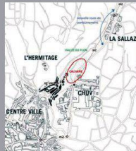
Localisation du site du concours (Extrait du programme du concours)

EXPOSITION RÉSULTATS CONCOURS RÉSERVOIR DU CALVAIRE - CONSTRUCTION DE 150 À 180 LOGEMENTS, VALORISATION DES PARCELLES 3201 ET 3202 f'ar Lausanne Finissage et discussion dimanche 10 mars à 17h00 www.archi-far.ch