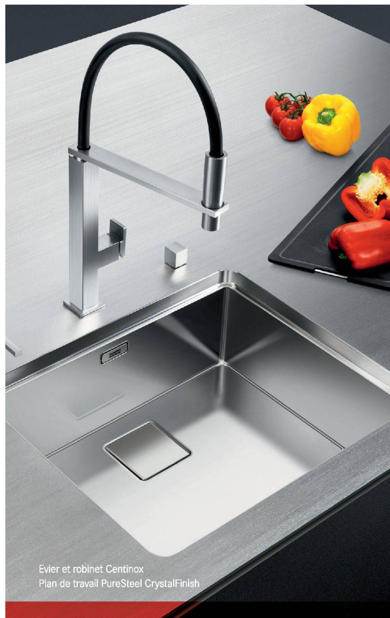
Evier et robinet Centinox Plan de travail PureSteel CrystalFinish

Musée d'art moderne et contemporain, Genève Jusqu'au 5 mai 2013, www.mamco.ch