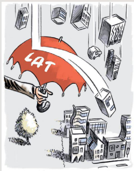
Illustration Nicolas Bischof

La révision proposée répond à ces exigences et bénéficie d'un soutien unanime à tous les échelons institutionnels. Et comme la Confédération, les cantons et les communes se partagent les responsabilités dans l'application de la Loi sur l'aménagement du territoire,