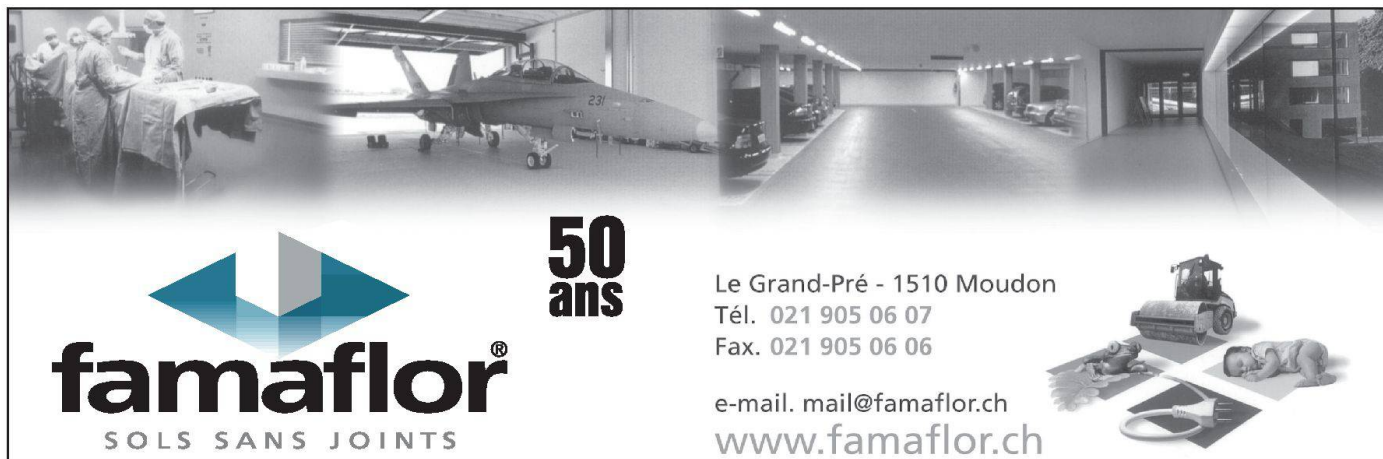
Illustration : Bruno Souëtre