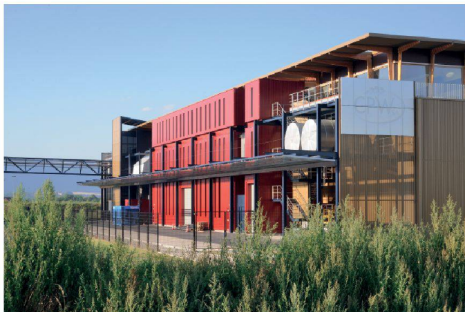
Le CPW Innovation Centre à Orbe