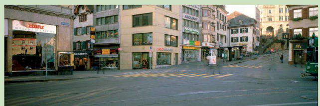
Diener & Diener, Neubau Steinenvorstadt 2 / Kohlenberg 1 Basel, 1995

EXPOSITION PHOTOGRAPHY FOCUSING ON SWISS ARCHITECTURE Large panorama photographique de la création architecturale suisse des 25 dernières années. S AM Schweizerisches Architekturmuseum Steinenberg 7, 4001 Basel www.sam-basel.org