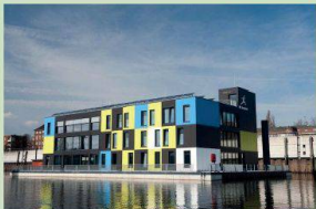
IBA DOCK der IBA Hamburg

EXPOSITION STADT NEU BAUEN - EINE REISE IN DIE METROPOLE VON MORGEN. HAFENCITY UND IBA, HAMBURG Haupthalle, Zentrum, ETH Zürich www.gta.arch.ethz.ch/ ausstellungen/stadt-neu-bauen