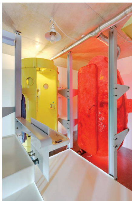
Sanitaires et douche dans une coopérative d'habitants à Berlin

Inscription / Renseignement: IMP Bautest SA conseils techniques et analyse chimique Route de Fribourg 71 CH-3280 Morat Téléphone 026 670 07 07 www.impbautest.ch