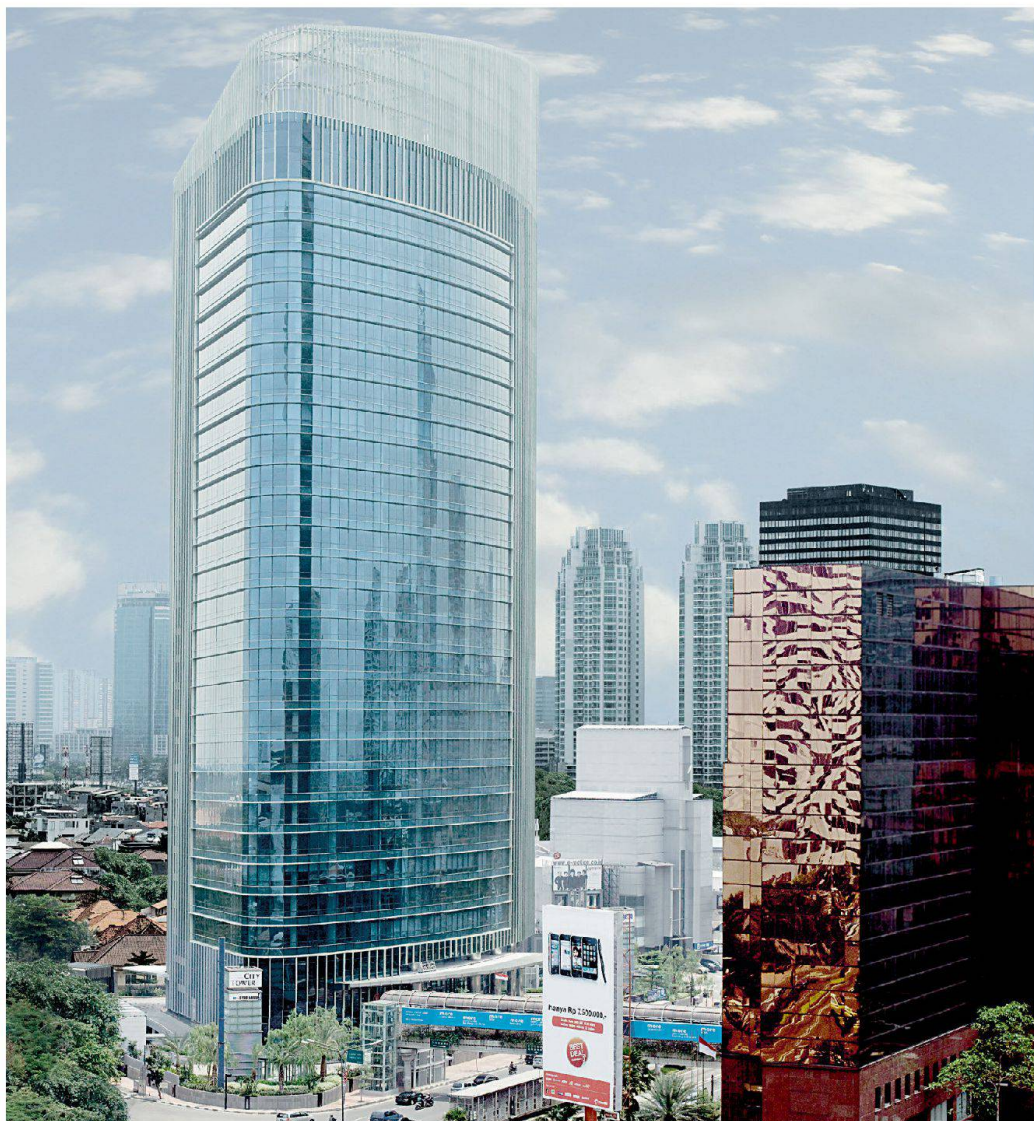
City Tower, Jakarta