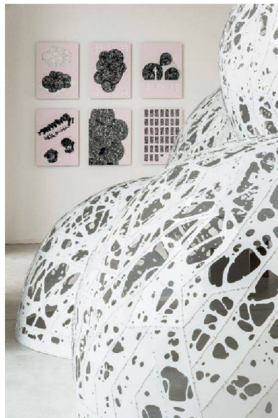
MARC FORNES & THEVERYMANY™, «Double Agent White», 2012 Exposition « ArchiLab - Naturaliser l'architecture »