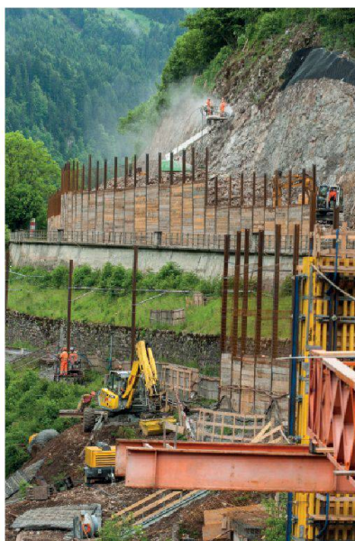
Le chantier de la Chaudanne