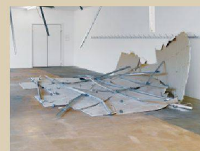
Delphine Reist, La Chure, 2013