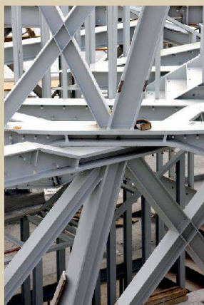
Actelion Business Center, Allschwil

Architekturfoyer, HIL, ETH Zürich www.ausstellungen.gta.arch.ethz.ch