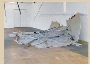
Delphine Reist, La Chure , 2013