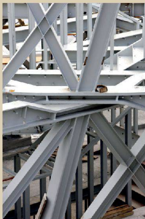
Actelion Business Center, Allschwil

Architekturfoyer, HIL, ETH Zürich www.ausstellungen.gta.arch.ethz.ch