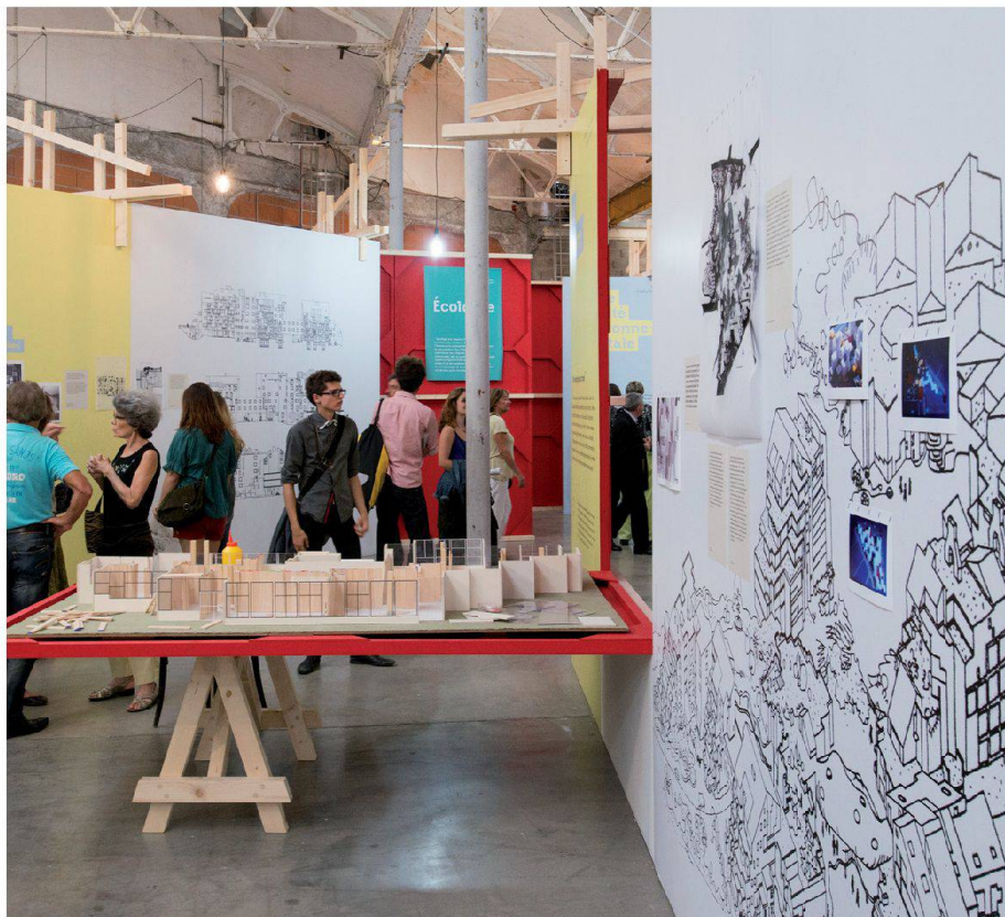
Exposition rétrospective de l'Atelier Kroll au lieu unique à Nantes