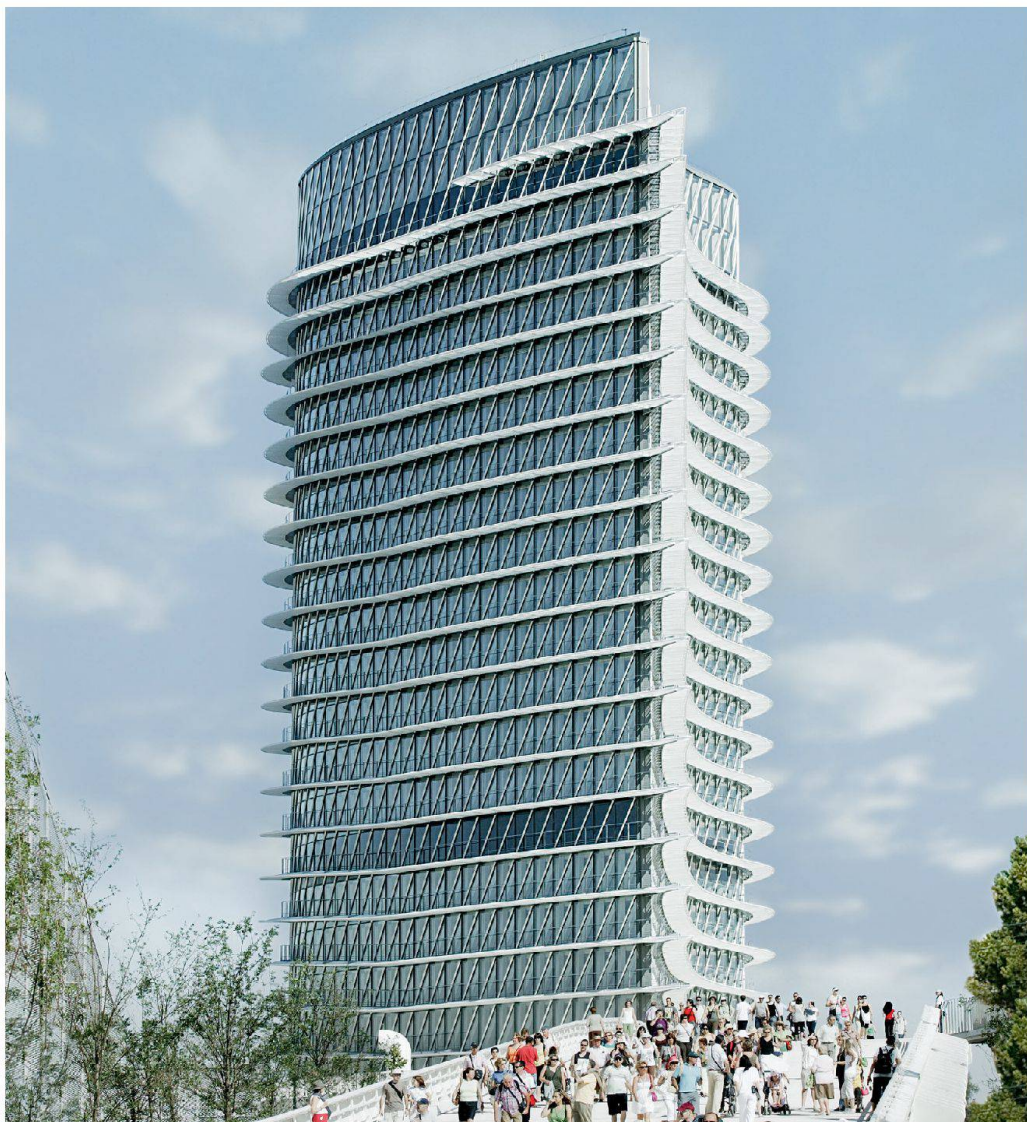
Torre del Agua, Zaragoza