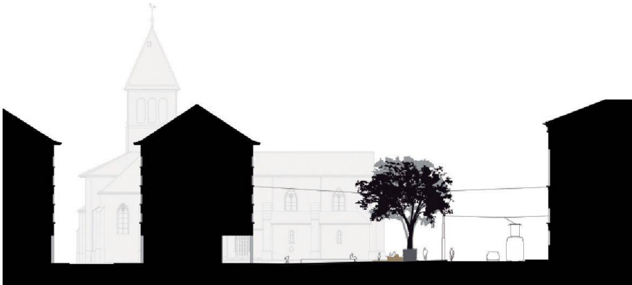
3, 4 Plan de situation et coupe (Document Atelier Descombes Rampini SA) 5 Les différentes délimitations de la place Simon-Goulart