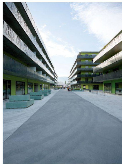
L'axe central du quartier, la rue de la Coupe Gordon-Bennett

Donnez la capacité totale de mouvement à la structure de l'immeuble et créez ainsi une utilisation optimale – Esthétique comprise évidemment!