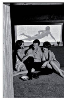
Hugh Hefner au Manor Playboy de Chicago, en 1966