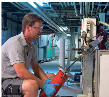
Une fois mélangée et dosée, la résine est conditionnée dans des cartouches en vue de son injection à l'intérieur du circuit réalisée sur place.

Avec le Système HAT, les conduites sont assainies par l'intérieur. L'eau restant dans le circuit de chauffage est d'abord vidangée à l'air comprimé et recyclée de manière écologique. Ensuite, on nettoie la paroi intérieure des conduites: on utilise pour cela un compresseur spécial qui injecte sous pression un mélange abrasif sans produits chimiques composé selon l'état de l'installation. Ce mélange éli-