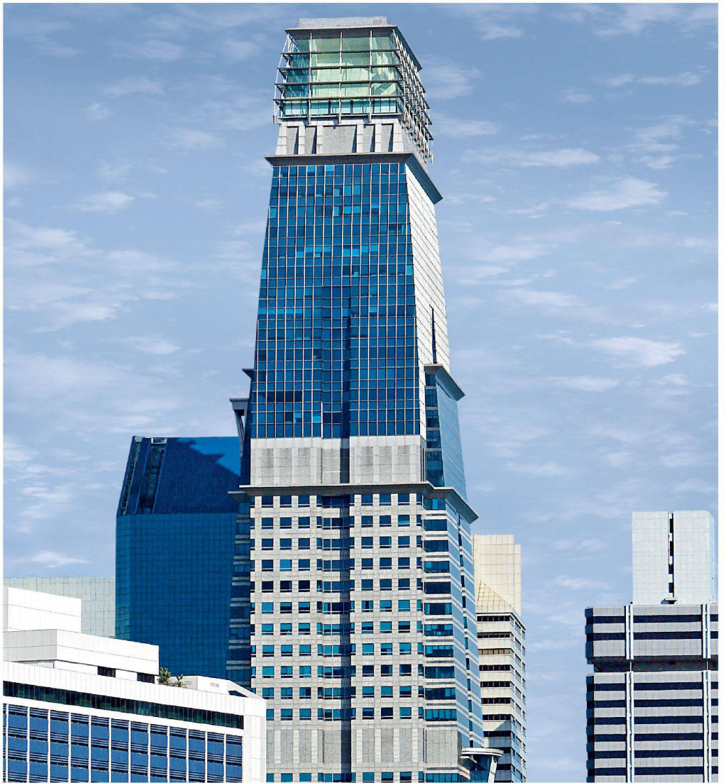
Singapore Capital Tower