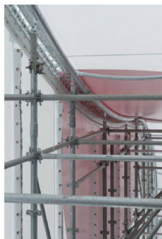
7 Vue du chantier