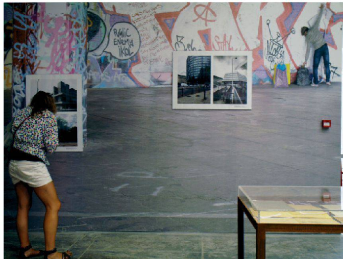
Vue de l'exposition de l'OMA au pavillon central des Giardini