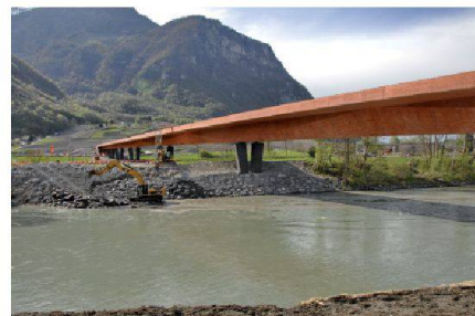
La ligne rouge