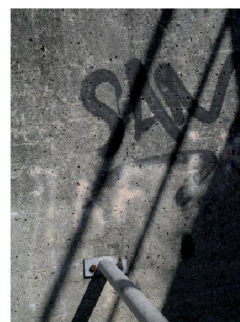
Graffiti sur un mur en béton