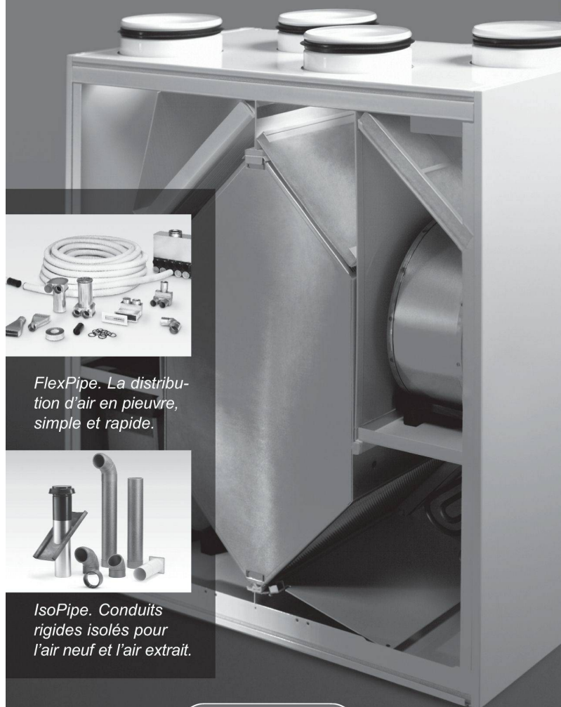
FlexPipe. La distribution d'air en pieuvre, simple et rapide.

pour la distribution de l'air et la régulation. Seul un accord parfait entre ces systèmes périphériques et le groupe de ventilation peut garantir au client un résultat optimal. De plus, la simplicité de mise en oeuvre des équipements Helios permet de réduire sensiblement les temps de pose. Demandez nous une documentation.