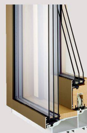
Portes coulissantes bois/métal de la marque Meko.