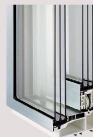
Portes coulissantes métalliques de la marque Schweizer.

Portes coulissantes et vitrages grand format et à haute isolation, profilés extra-minces et fabrication de première qualité, avec, en outre, un grand confort d'utilisation et des valeurs U jusqu'à 0,59 W/(m 2 K). Notre conception de la technique des fenêtres!