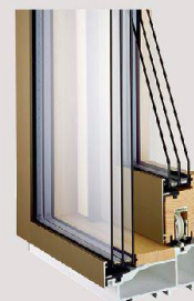
Portes coulissantes bois/métal de la marque Meko.