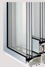
Portes coulissantes métalliques de la marque Schweizer.

Portes coulissantes et vitrages grand format et à haute isolation, profilés extra-minces et fabrication de première qualité, avec, en outre, un grand confort d'utilisation et des valeurs U jusqu'à 0,59 W/(m²K). Notre conception de la technique des fenêtres!