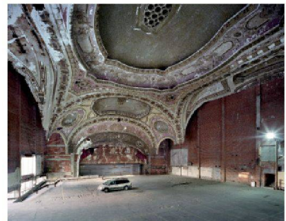
Détroit, théâtre abandonné reconverti en parking

La ville - invisible, décriée, maltraitée Yvette Jaggi