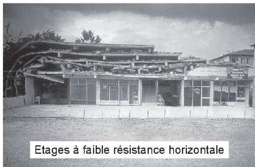
Etages à faible résistance horizontale