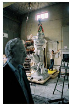
Une œuvre d'Urs Fischer pour la Biennale de Venise en production au Sitterwerk